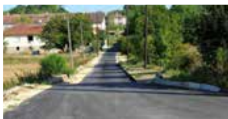
RUE DES FONTENETTES