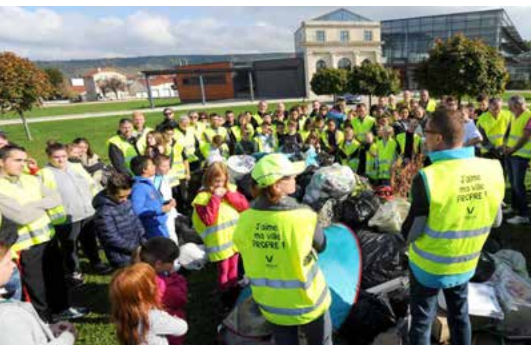
Rassemblement devant l'Aquadrome en fin de matinée.

Parents, enfants, associations, commerçants, élus et centres sociaux se sont rassemblés pour cette nouvelle collecte. Un geste militant pour le respect de l'autre et davantage de salubrité publique.