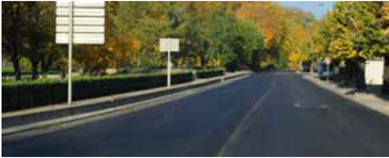
AVENUE DU LUXEMBOURG