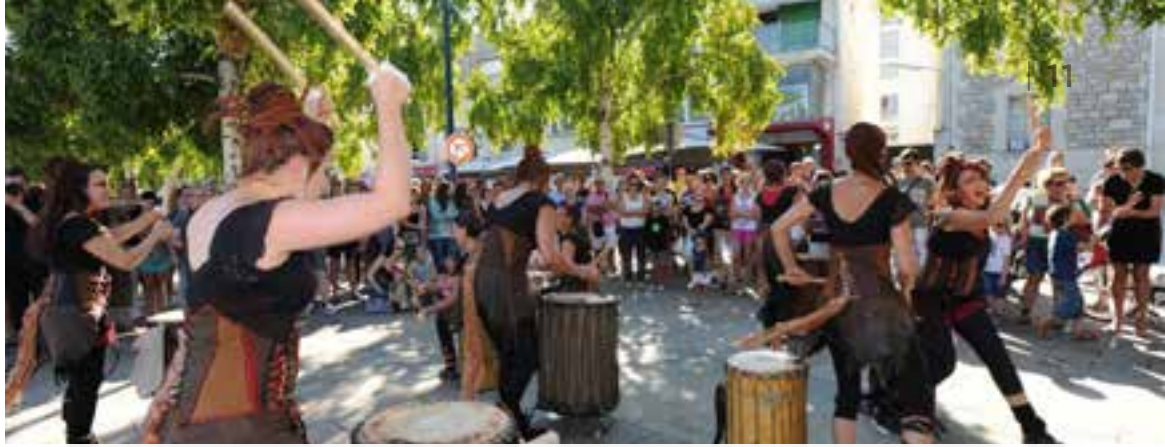
JUILLET & AOÛT 2015 | RAMDAM SUR LE QUAI