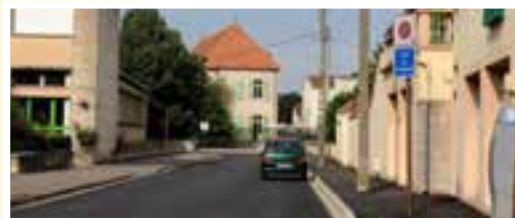
RUE DU BRACHIEUL