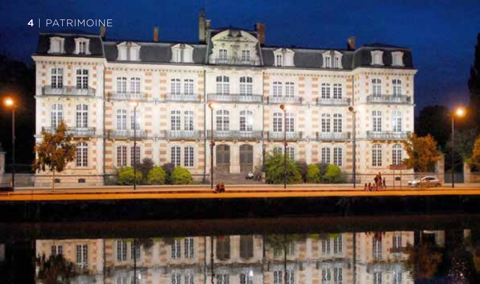
Le Mess des Officiers