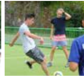
JUILLET & AOÛT 2015 | ACTIV' ÉTÉ