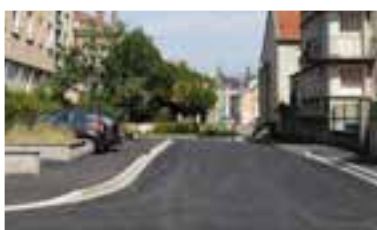
RUE LOUIS COUTEN