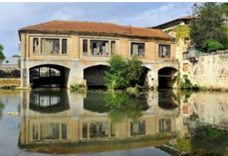
L'ancienne usine électrique

Par ailleurs, cette volonté d'optimisation du parc immobilier permet d'offrir de nouveaux services avec en particulier, cette année, la création d'une maison des associations dans les anciennes écoles du Faubourg, complétée par des mises à disposition d'anciens lieux d'accueil périscolaire de la collectivité.