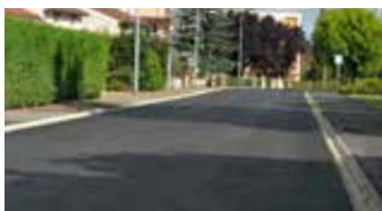
RUE DE LA CHARRONIERE