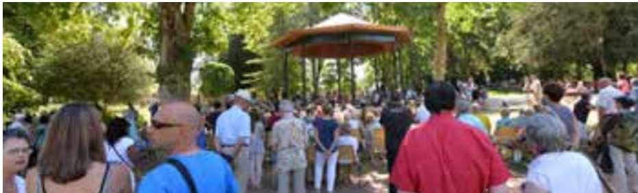
AOÛT 2015 | 5 E ÉDITION DES FLÂNERIES MUSICALES DE JAPIOT