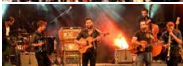
JUIN, JUILLET & AOÛT 2015 | FESTIVAL MUSIQUES ET TERRASSES SUR LE QUAI DE LONDRES