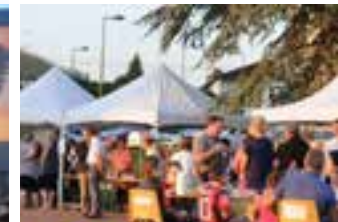
JUILLET & AOÛT 2015 | CINÉ PLEIN AIR