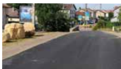
RUE DES ALLONVEAUX