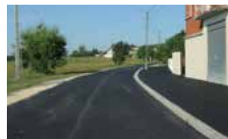
RUE DE BLAMONT