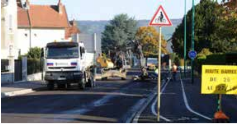
AVENUE DES EPARGES