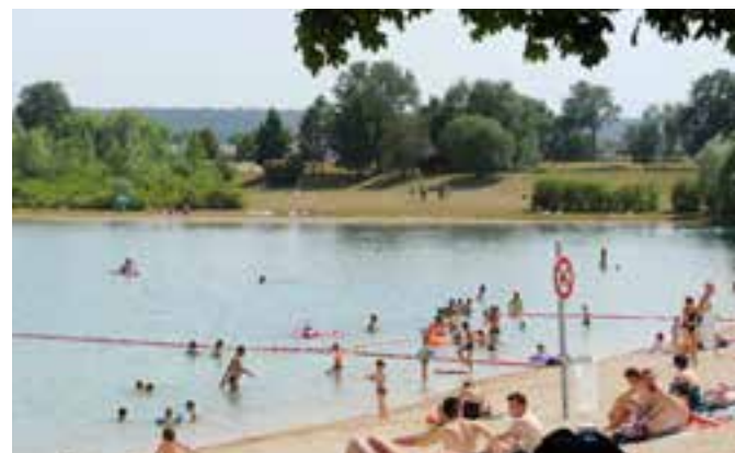
VERDUN PLAGE ÉTÉ 2015