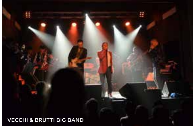
VECCHI &amp; BRUTTI BIG BAND