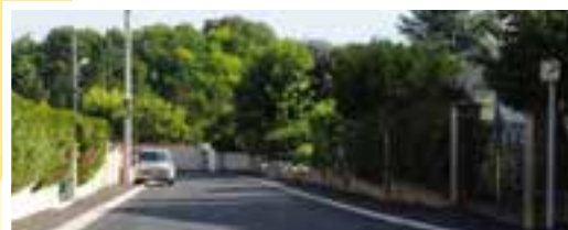
RUE DES GLACIS