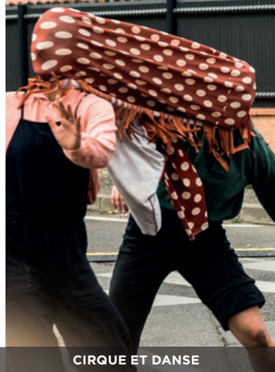
CIRQUE ET DANSE