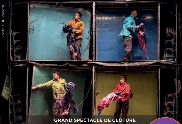
GRAND SPECTACLE DE CLÔTURE