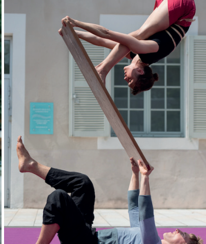
PORTÉE ACROBATIQUE / ROLA BOLA