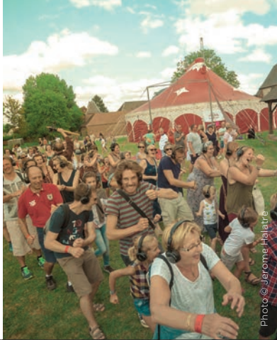
PARTICIPATIF & DÉAMBULATOIRE