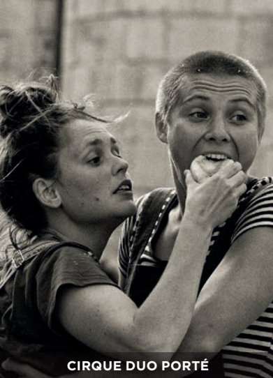
CIRQUE DUO PORTÉ