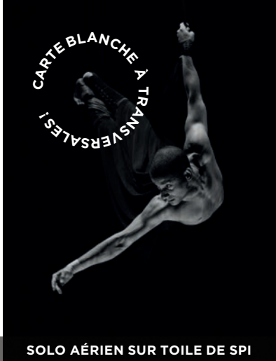
SOLO AÉRIEN SUR TOILE DE SPI