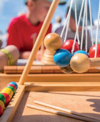
JEUX EN ACCÈS LIBRE