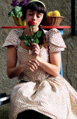
THÉÂTRE DE RUE