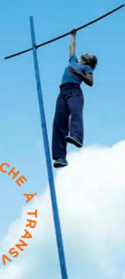
CIRQUE - STRUCTURE SCULPTURE