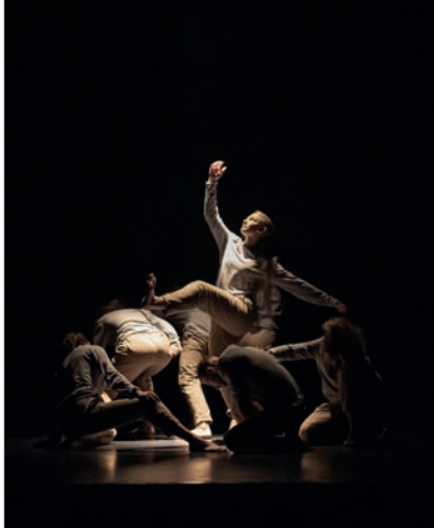
DANSE CONTEMPORAINE - HIP HOP

Fragiles et traversés par l'humour de ces corps incertains, boursoufflés de formes, les personnages plongent la rencontre dans l'aléatoire, la tentative et l'étrange. La dérision emporte tout, nos doutes et nos certitudes, et ouvre sur une autre danse. L'expérience de la déformation mise en jeu avec le mouvement a ouvert de nouveaux champs de perception ; l'émotion naît de ces situations sensibles.