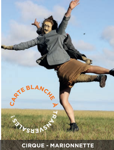
CIRQUE - MARIONNETTE