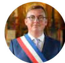
Samuel HAZARD Maire de Verdun Président de la CAGV

Merci à tous ceux qui font de ces fêtes un moment inoubliable. Ensemble, faisons briller l'esprit de Noël dans le cœur de Verdun !