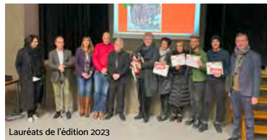
Lauréats de l'édition 2023

Ensemble, continuons à faire de notre ville un lieu vivant et convivial, où le commerce local prospère.